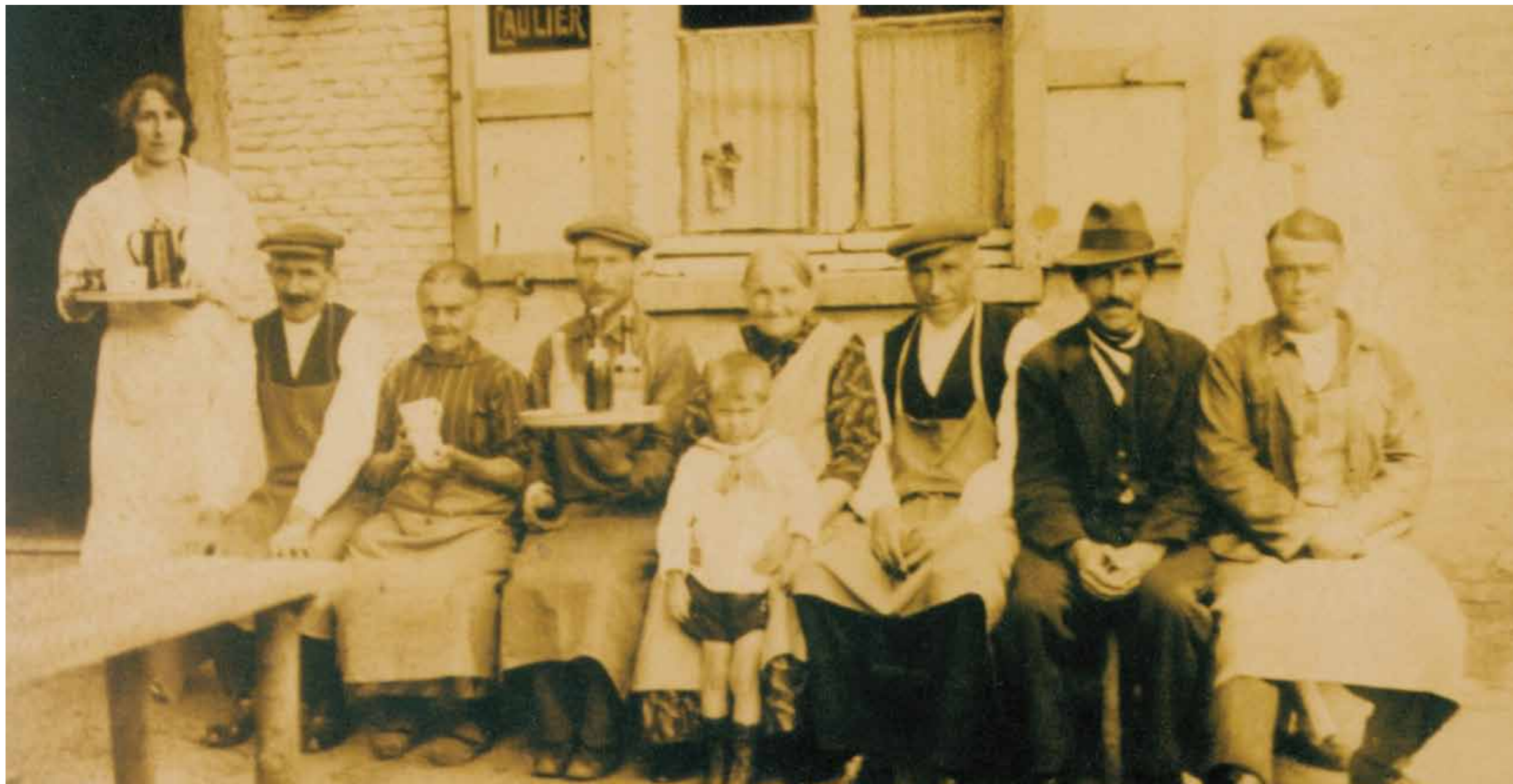
EIGENAARS EN PERSONEEL OMSTREEKS 1900

WELKOM IN ÉÉN VAN DE MEEST HISTORISCHE CAFÉS VAN ANTWERPEN. VAN 1420 TOT 1920 WAS DE BREMDONCK-HOEVE BEDRIJVIG ALS BOERDERIJ. DE HUIDIGE GEBOUWEN DATEREN VAN ± 1630. ROND DE EEUWWISSELING BEGON MEN MELK, LIMONADE, BIER EN BROOD TE VERKOPEN AAN BEZOEKERS EN WANDELAARS. ONTELBARE MENSEN GENOTEN TOT OP HEDEN VAN DE GASTVRIJHEID EN GEZELLIGHEID VAN DE MELKERIJ.