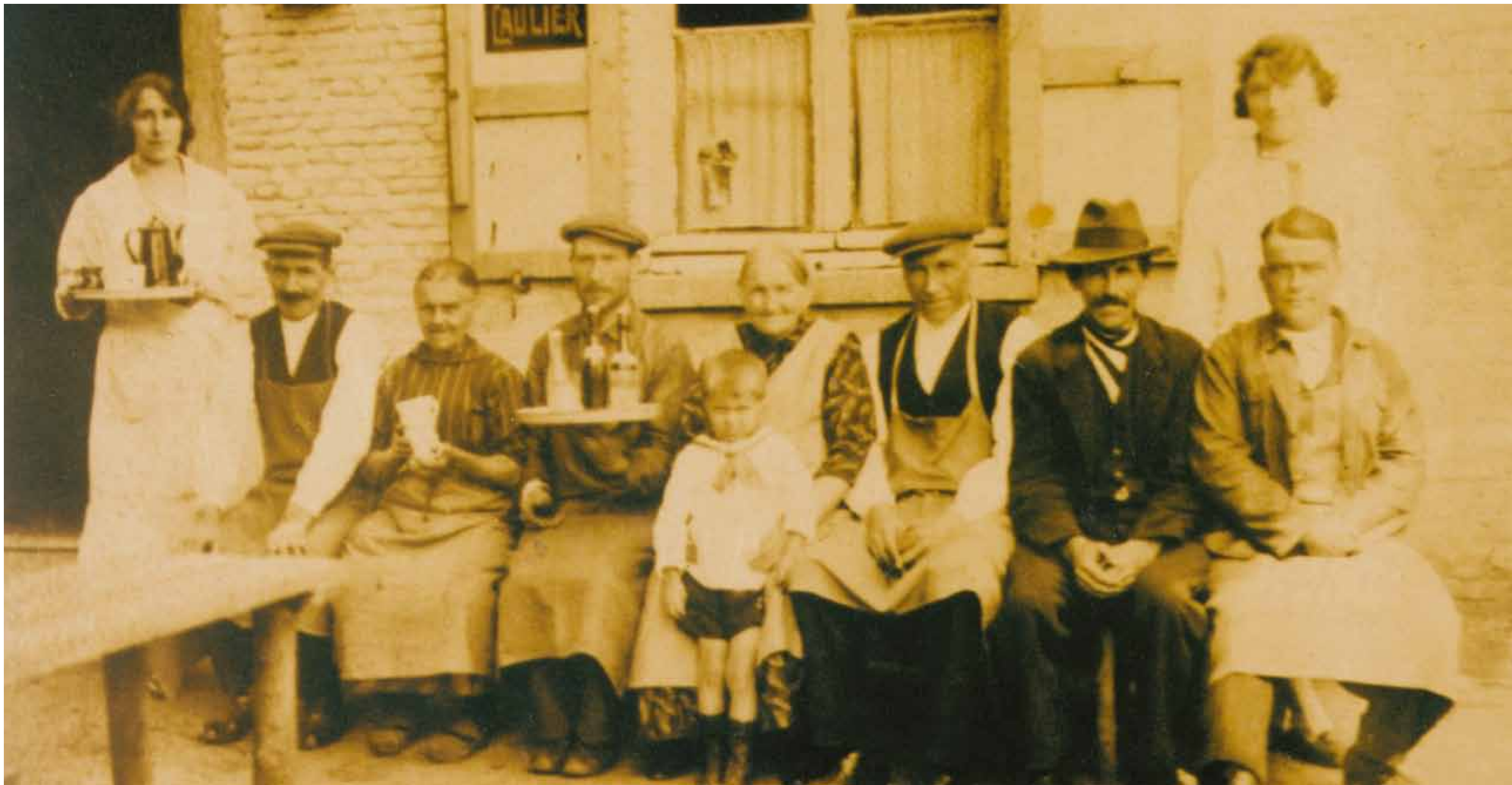
EIGENAARS EN PERSONEEL OMSTREEKS 1900

WELKOM IN ÉÉN VAN DE MEEST HISTORISCHE CAFÉS VAN ANTWERPEN. VAN 1420 TOT 1920 WAS DE BREMDONCKHOEVE BEDRIJVIG ALS BOERDERIJ. DE HUIDIGE GEBOUWEN DATEREN VAN +/- 1630. ROND DE EEUWWISSELING BEGON MEN MELK, LIMONADE, BIER EN BROOD TE VERKOPEN AAN BEZOEKERS EN WANDELAARS. ONTELBARE MENSEN GENOTEN TOT OP HEDEN VAN DE GASTVRIJHEID EN GEZELLIGHEID VAN DE MELKERIJ.